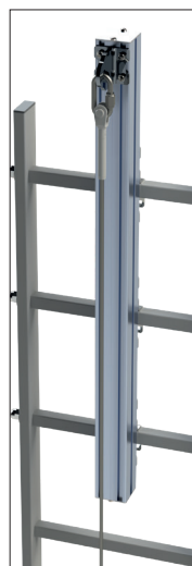
Barra de salida lateral